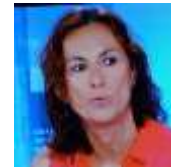
Pascale HEBEL CREDOC