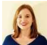
Sol ne JALLET AG2R La Mondiale